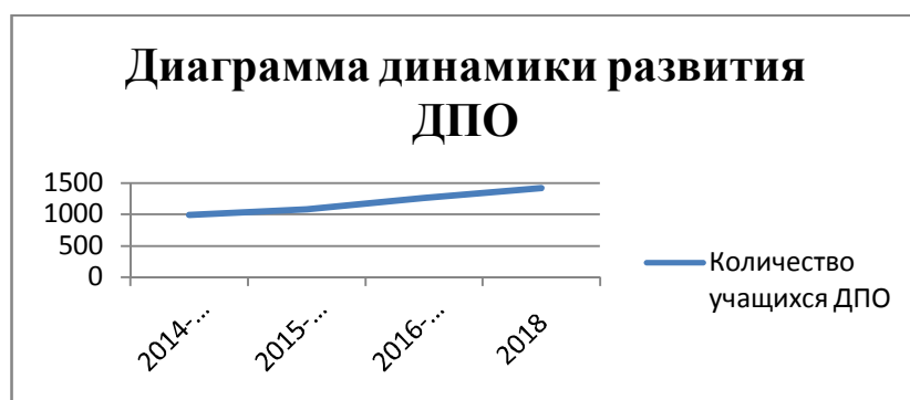
Диаграмма показывает положительную динамику развития дополнительного платного образования, его востребованности среди учащихся школы.