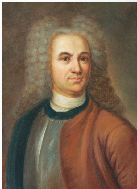
На фото: Татищев В.Н.

В начале 1720 г. Татищев получил назначение на Урал. Его задачей было определить места для строительства