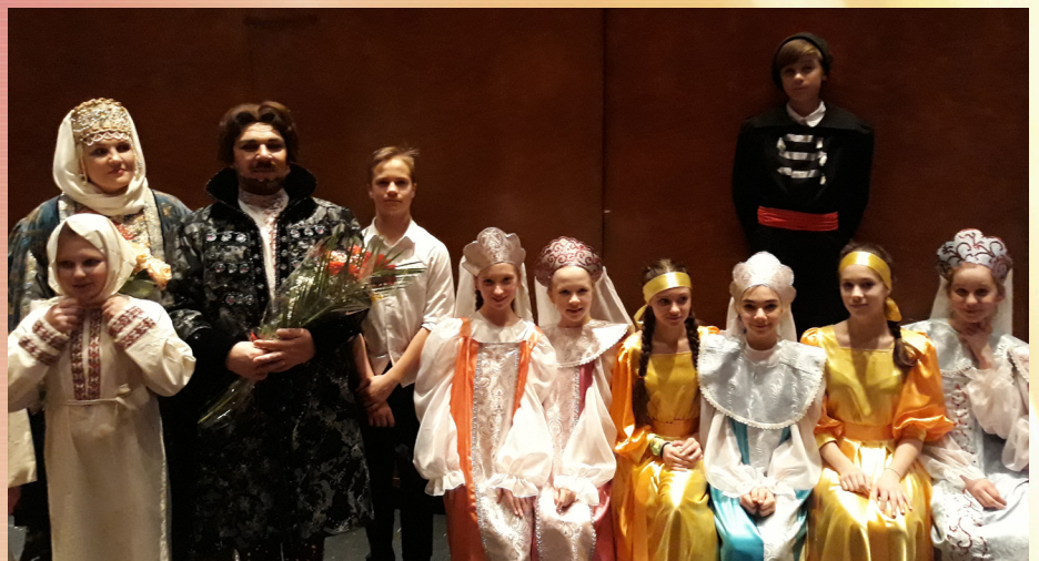
На фото: Участники проекта

Первое на что обращаешь внимание при просмотре спектакля – это музыка. Она передает настроение, состояние и даже мысли и характер героев. А голоса оперных певцов никого не могут оставить равнодушными. Огромный зал слушал, затаив дыхание. Поражают и костюмы