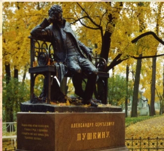
На фото: Памятник А.С. Пушкину