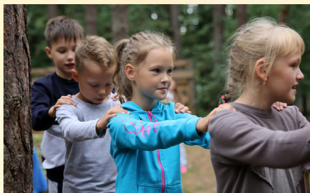
На фото: Ученики 3 «а» класса

Веревоочные курсы — это не только прерогатива старших классов. Сейчас даже самые маленькие проходят эти испытания. Так в начале сентября ученики 3 «А» класса нашей школы испытали свои силы, отправившись на базу «Чайка». Этот курс — довольно сложное испытание, однако, оно подарило детям самые замечательные воспоминания.