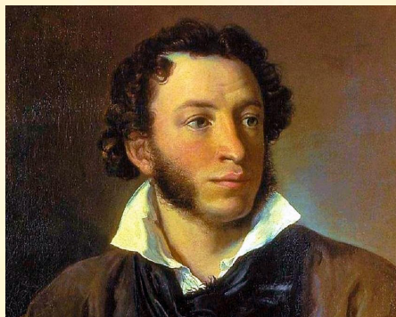
На фото: А.С. Пушкин

«А надо ли в нашей школе отмечать этот праздник?», – поинтересовались мы у учеников нашей школы. Самый распространенный ответ был таким: «А зачем? День лицея должен отмечаться в лицее, у нас школа». Встретилось и такое мнение: «Гимназическое и лицейское образование всегда считалось элитным. Отмечать надо для того, чтобы подчеркнуть важность образования в