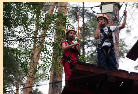
На фото: Ученики 3 «а» класса