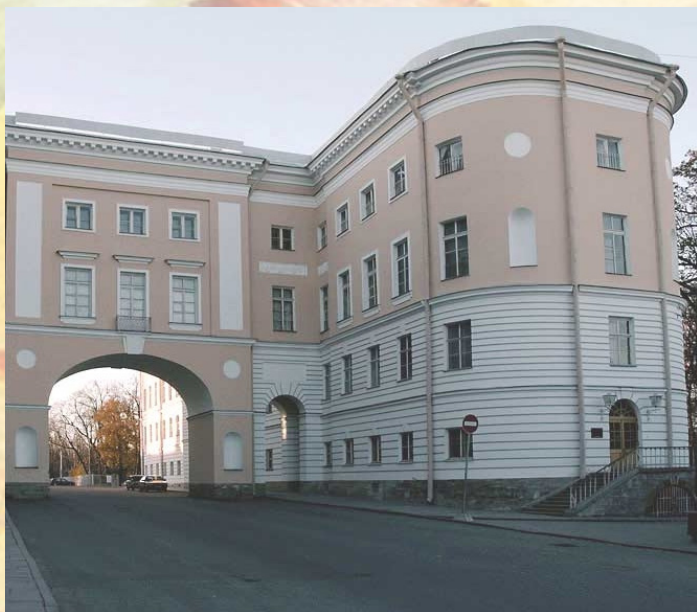
На фото: Царскосельский лицей