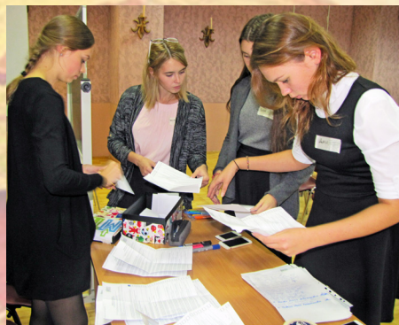
На фото: Избирательная комиссия 11 классов