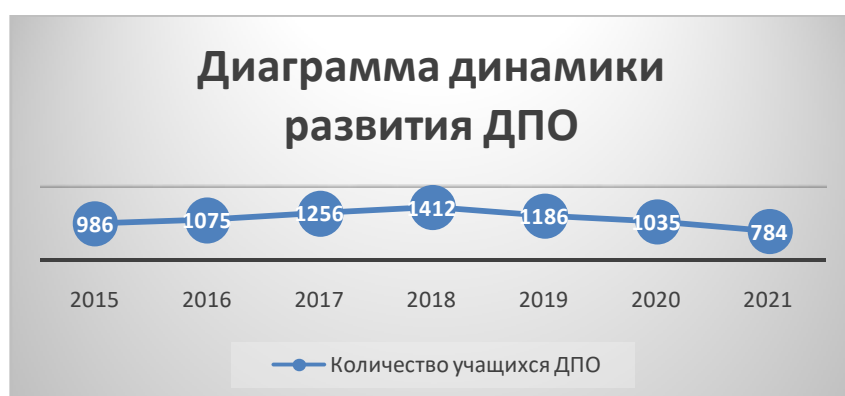
Диаграмма показывает снижение охвата учащихся дополнительным платным образованием, его востребованности среди учащихся школы.

67 выпускников (71%) Школы развития личности продолжили обучение в первом классе МАОУ «СОШ № 2» в 2022 году.