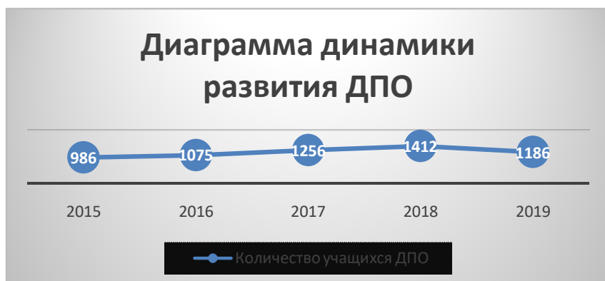
Диаграмма показывает отрицательную динамику развития дополнительного платного образования, его востребованности среди учащихся школы.